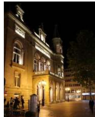
Cercle by Night.