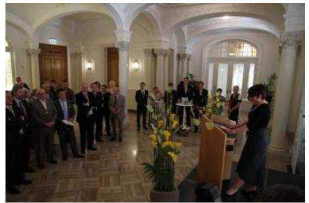
Die Räumlichkeiten des Cercle waren perfekt für die Eröffnung des Kongresses.