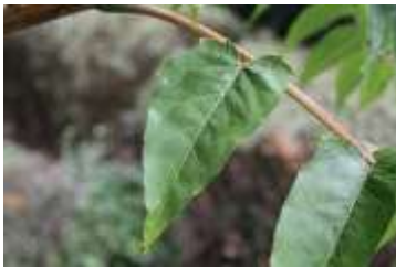
Oben & unten: Ailanthus altissima