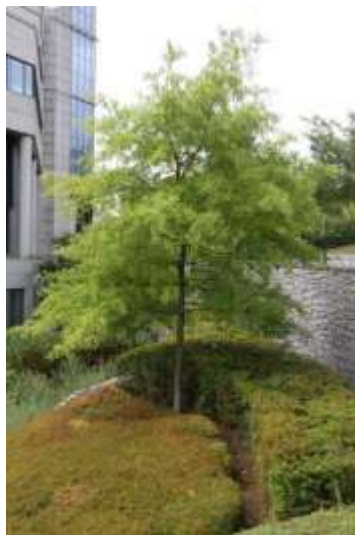
Oben: Quercus palustris