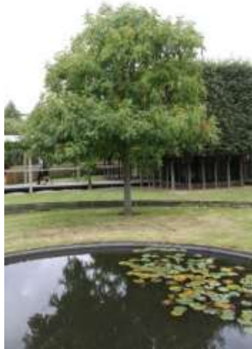
Oben: Koelreuteria paniculata