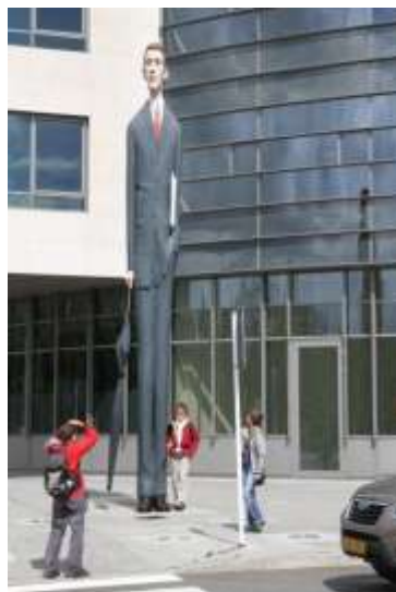
The Banker, beliebtes Fotomotiv auf dem Weg zum Zentralpark.