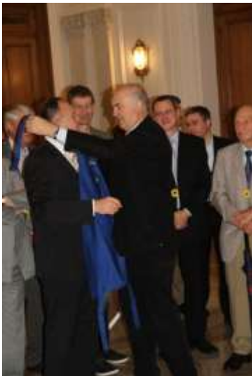
Die blaue CEJH-Schürze gesponsert vom Luxemburger Marktverband ein Präsent an alle Partner des Kongresses, auch der Landwirtschaftsminister war sichtlich erfreut.