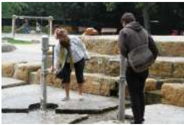
Teil Louvigny : Villa Louvigny nach 1930 abgerissen und durch Neubau ersetzt (lange Zeit Sitz von Radio Luxemburg, heute vom Gesundheitsministerium belegt). Große Wiese vor Villa Louvigny war Spielplatz, neues Projekt « Wasser-Abenteuer-Spielplatz ».