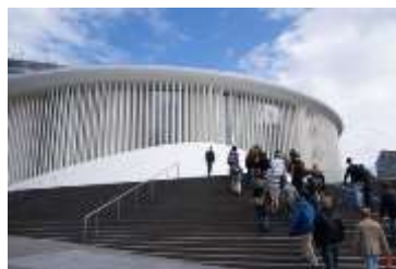
Die « Place de l'Europe » mit der Philharmonie & dahinter dem „MUDAM“ dem zeitgenössischen Kunstmuseum vom sinoamerikanischen Architekten Ioh Ming Pei, welcher auch die Pyramiden des Louvre entworfen hat.