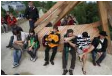
Erholung am Traumzweig im Zentralpark mit perfektem Blick über das Plateau.