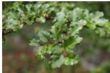
Die 3 vorherigen Bilder: Notofagus antartica .