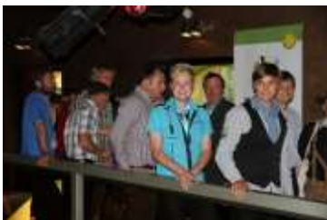
Die größte Delegation, die Arbeitsgemeinschaft Deutscher Junggärtner.