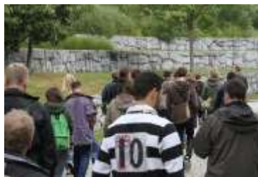
Auf in den nichtöffentlichen Ost-Teil.