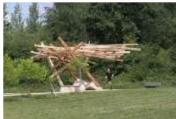
Läufer unter Traumbaum, dieses Foto wurde beim Fotowettbewerb – SinCityPics – Stolen moments – der Fondation de l'Architecture im Oktober 2011 von den Junggärtnern Luxemburg eingereicht.