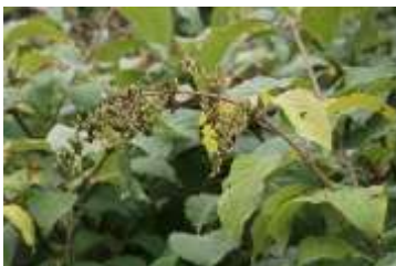
Oben: Syringa reflexa