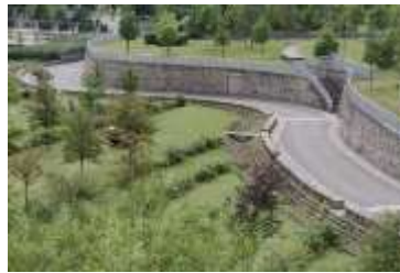
Der kleine Kirchberg als Aussichtsplattform über das Kirchberg-Plateau.