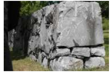
„Pierre bleue“ belgischer Marmor.