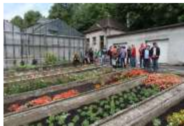
Blick hinter die Kulissen, die Stadtgärtnerei, Esch.