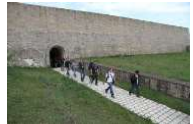
Durch die Festung „Fort Thüngen“ zurück zur Jugendherberge, Klausen.