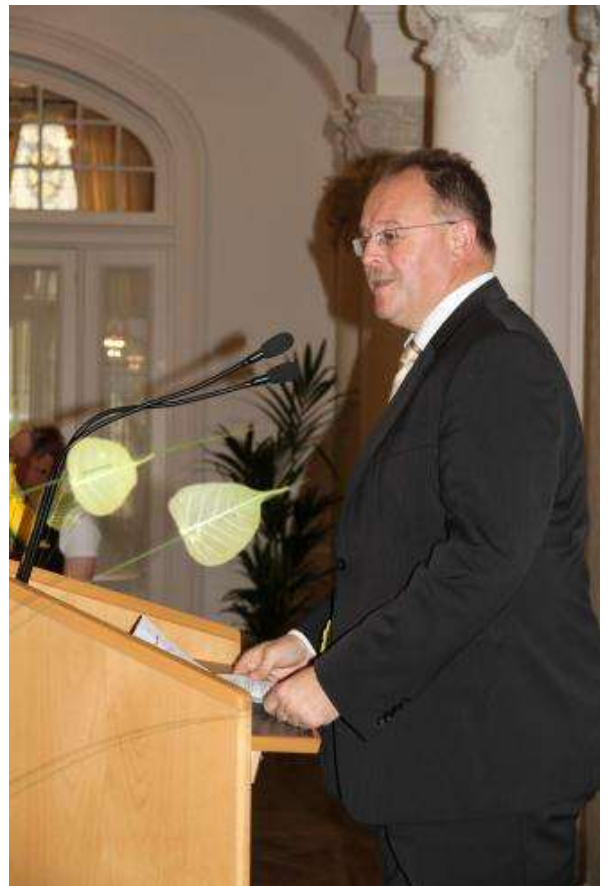
Landwirtschaftsminister Schneider freut sich die zahlreichen jungen Gäste aus Europa begrüßen zu dürfen.