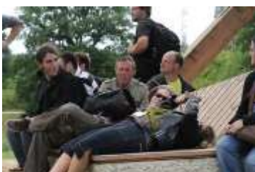
Erholung im Klosegrendchen unter dem Traumbaum von Architekt Paul Majerus.