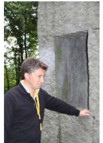
Ulrich Rückriem Skulptur ohne Titel - Vier Variationen zum Thema Bildstock – Kunst im öffentlichen Raum & Tom Penning.